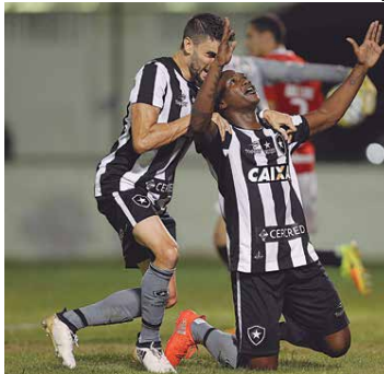
O Botafogo venceu o Inter-RS na última rodada e entrou no G6