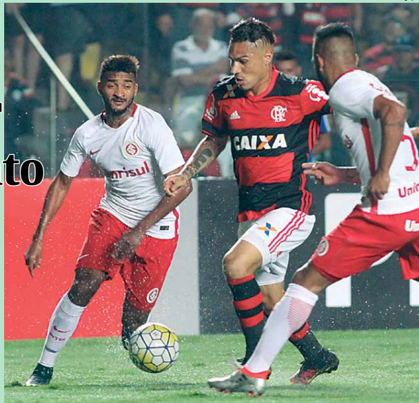
Na primeira turno, o Flamengo venceu o Inter-RS por 1 a 0, em jogo disputado em Cariacica, no Espírito Santo

Mas o técnico Zé Ricardo já tirou os jogadores deste foco e quer muito mais concentração nessa caçada contra o líder Palmeiras, já que a diferença diminuiu outra vez para apenas um ponto. A novidade será a volta do atacante Paulo Guerrero que foi poupado no jogo de Volta Redonda, mas ele ainda não decidiu se Damiano será a opção no banco.