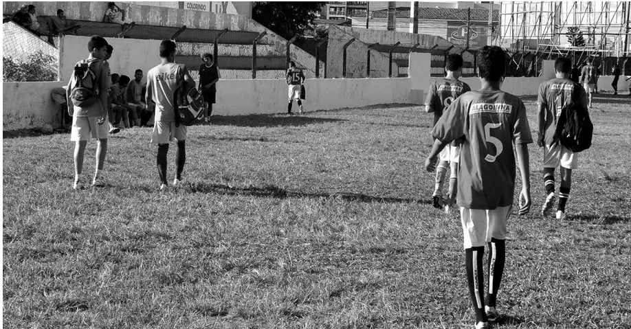
Jogadores do Internacional treinaram na última sexta-feira no Mangabeirão para o primeiro jogo decisivo de hoje contra o Serrano valendo o título da Segunda Divisão

"Eu falei que era uma escada. Chegamos ao oitavo degrau, que era o decisivo, e conseguimos o acesso. A expectativa era essa. Agora é batalhar para que a gente comece esse trabalho com o título desses jogos finais contra o excelente time do Internacional", expolico.