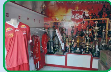
A loja do Auto funciona na sede do clube no Mangabeirão