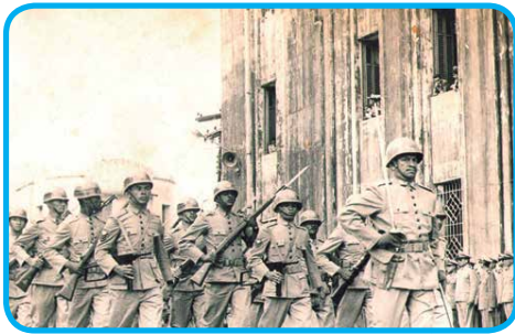
Fotos antigas e vários tipos de armas estão expostas no Memorial