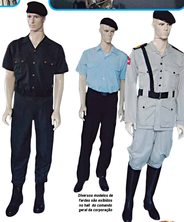
Diversos modelos de fardas são exibidos no hall do comando geral da corporação

Em 2 de junho de 1835, o coronel Elísio Sobreira foi nomeado comandante do recém-criado Corpo de Guardas Municipais, depois denominado Força Policial e Força Pública. A denominação de Polícia Militar da Paraíba veio em 1947. Antes, em 1849, a corporação já havia combatido a Revolução Praieira, um movimento armado surgido no Recife. Em 23 de junho de 1865, 210 homens da Força Policial Paraibana, sob o comando do major José Vicente Nogueira da Franca embarcaram para o Rio de Janeiro, capital do Império, a fim de se juntar ao Exército Imperial e combater na Guerra do Paraguai.