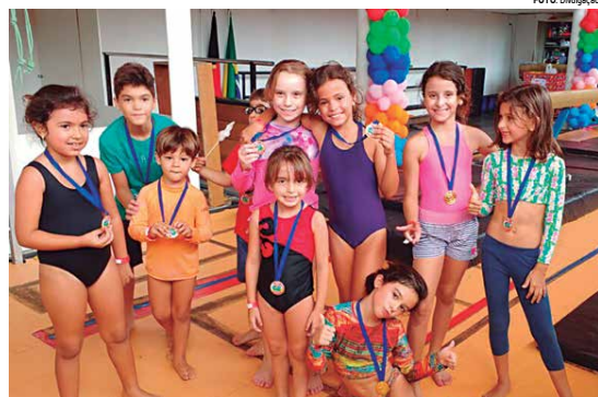
Turminha da pesada campeã nos torneios do Dia das Crianças no Clube Cabo Branco